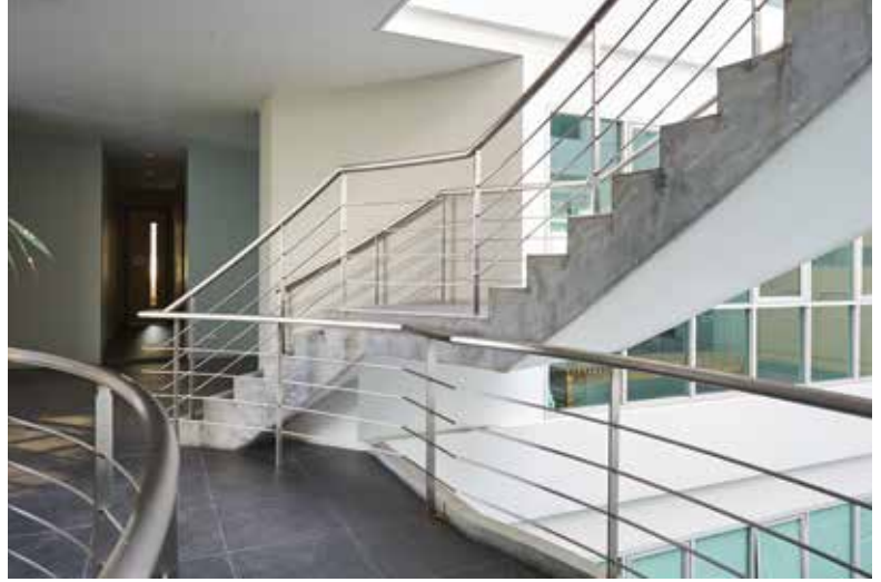
บันไดทางขึ้นระหว่างชั้น ที่เน้นให้ทุกคนเดินขึ้นลงระหว่างชั้น โดยการใช้บันไดเป็นหลัก เพื่อเป็นการออกกำลังกายไปในตัว